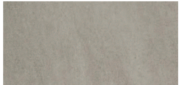
63355 Granitgrau Granite grey Gris granit