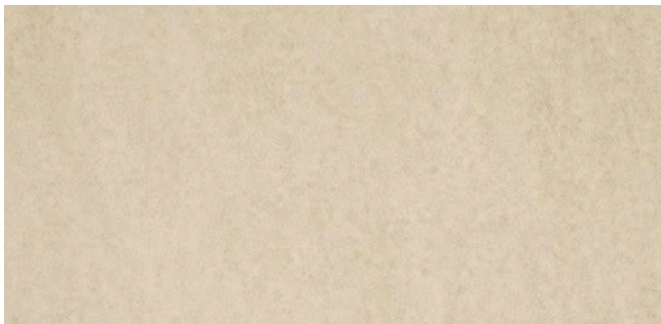
63155 Sandbeige Sand beige Beige sable