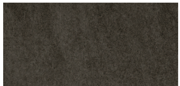
63955 Vulkanschwarz Volcanic black Noir volcan