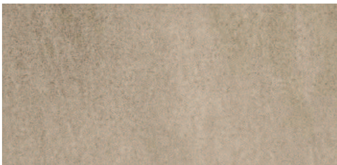
63255 Steingrau Stone grey Gris pierre