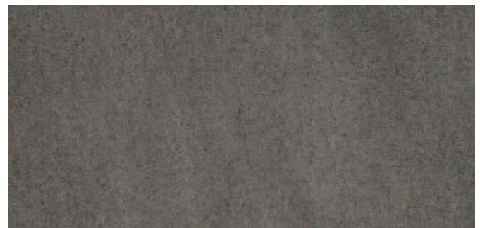
63755 Lavagrau Lava grey Gris lave