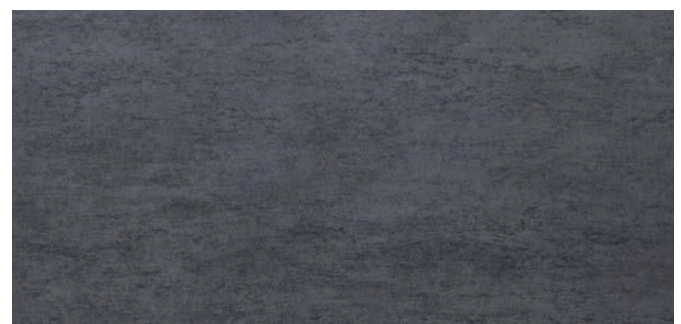
6675 Dunkelanthrazit Dark anthracite Anthracite foncé