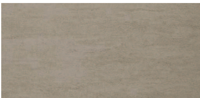
6672 Mittelbraun Medium brown Brun moyen