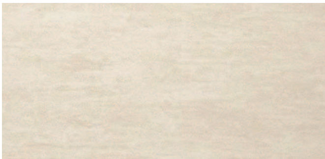
6670 Hellbeige Light beige Beige clair