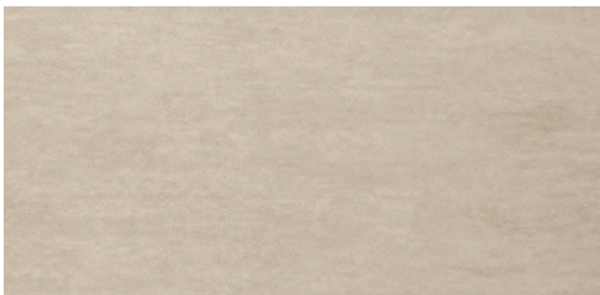
6671 Dunkelbeige Dark beige Beige foncé