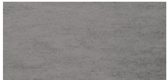
6674 Dunkelasphalt Dark asphalt Asphalte foncé