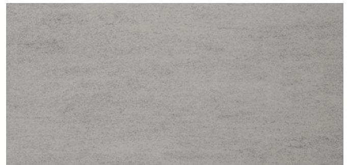
6673 Asphaltgrau Asphalt grey Gris asphalte